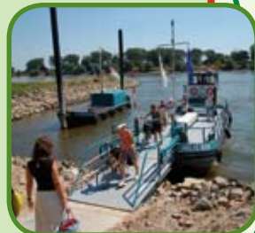
Veerdienst Millingerwaard - Doornenburg

Heeft u op- of aanmerkingen over de bewegwijzering, de route of de bijbehorende fietsroutekaart, dan kunt u contact opnemen met het routebureau van het Regionaal Bureau voor Toerisme KAN via www.lekkerfietsen.nl en T. 0900-6070803 (15 cpm).